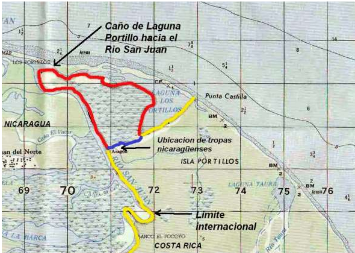
Figura indicando ubicación del caño "Google" o Caño "Pastora" excavado por Nicaragua en Isla Portillos en octubre del 2010 en azul a partir del error de Google Earth y en rojo el territorio declarado "en litigio" según la CIJ el 8 de marzo del 2011 (figura elaborada por el Dr. Allan Astorga).

A mediados del 2011, la prensa de Costa Rica se hizo eco de un proyecto de construcción de una ruta denominada “trocha fronteriza” de 154 kilómetros, en condiciones irregulares (véase nuestro modesto artículo sobre tan peculiar denominación, disponible aquí ). Oficialmente, esta ruta se justificó como respuesta a la “invasión” y a la “agresión” sufrida por Costa Rica en octubre del 2010. La ausencia de estudios en materia ambiental se justificó por parte de las autoridades en razón de la “emergencia” decretada como tal en marzo del 2011. En diciembre del 2011, Nicaragua presentó a la CIJ una demanda formal contra Costa Rica por la construcción de esta ruta paralela al Río San Juan y a parte de la frontera terrestre (ver texto de la demanda) y por los daños ocasionados al río San Juan.